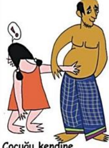
Çocuğu kendine dokunmaya zorlamak