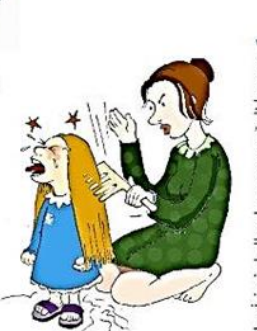
Çocuğu gereksiz yere ağlatmak