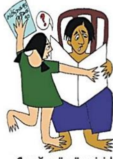
Çocuğun özgüvenini kırmak