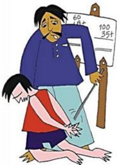
Okulda çocuğa vurmak veya aşagılamak