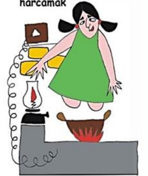
Zarar verecek durumlarda çocuğu denetimsiz bırakmak