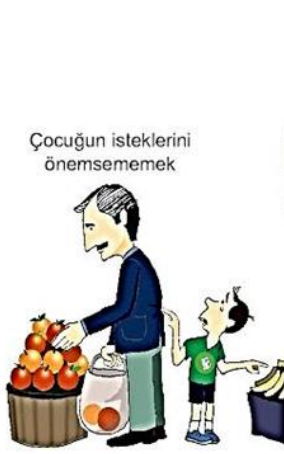
Çocuğın isteklerini önemsememek