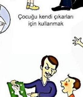
Çocuğu kendi çıkarları için kullanmak