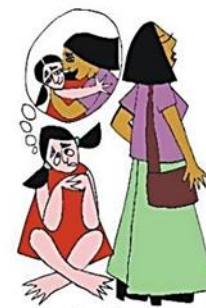
Çocuğun duygusal gereksinimlerini göz ardı etmek