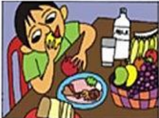
BESLEYİCİ GIDALAR YEMEK