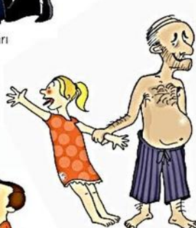
Çocuğu kendine dokunmaya zorlamak