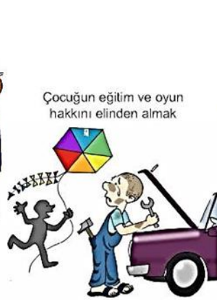
Çocuğın eğitim ve oyun hakkını elinden almak