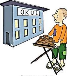
Çocuğın eğitim gereksinimlerini göz ardı etmek