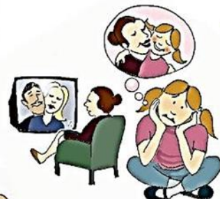
Çocuğın duygusal gereksinimlerini göz ardı etmek