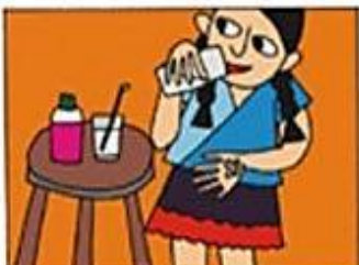
GEREKTEĞİNDE İLAÇ ALMAK