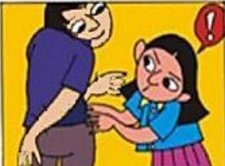
AZARLAMAYA, İTİLMEMEYE KARŞI KENDİMİZİ KORUMAK