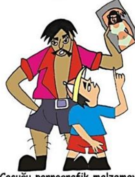
Çocuğu pornografik malzemeye veya davranışlara maruz bırakmak