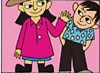
UYGUN ELBİSELER GİYMEK