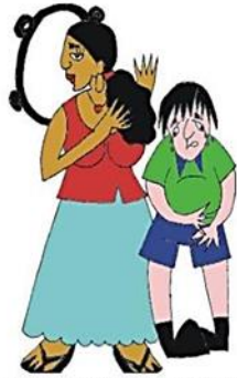
Çocuğun tıbbi gereksinimlerini göz ardı etmek