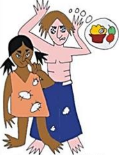
Çocuğa yeterli bakım sağlamamak, ör: Kirli, çıplak, aç bırakmak