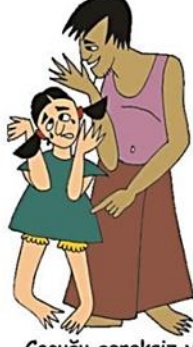
Çocuğu gereksiz yere ağlatmak