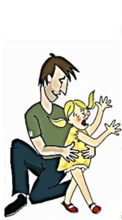
Çocuğın dokunulmasını istemediğı yerlerine dokunmak