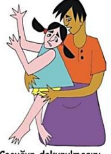
Çocuğun dokunulmasını istemediği yerlerine dokunmak