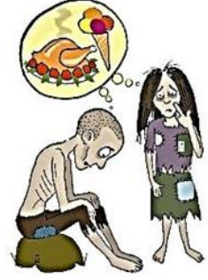
Çocuğa yeterli bakım sağlamamak. Örneğın kirlı, çıplak, aç bırakmak