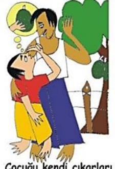
Çocuğu kendi çıkarları için kullanmak