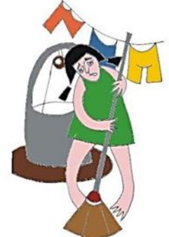
Başka işler yaptırarak çocuğun eğitim ve hobileri için kullanacağı zamanı harcamak