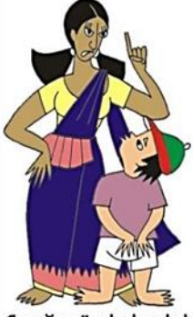
Çocuğu sözel olarak hırpalamak