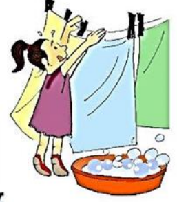
Çocuğu hizmetçi gibi kullanmak