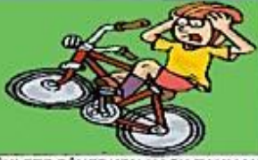
BİSİKLETE BİNERKEN KASK TAKMAK

VÜCUDUMUZU KORUMANIN BİR ÇOK YOLU VARDIR