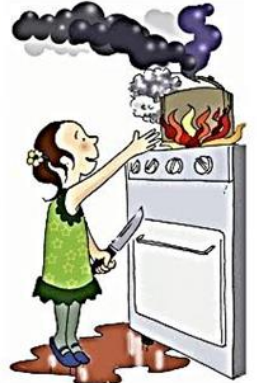
Zarar verecek durumlarda çocuğu denetimsiz bırakmak