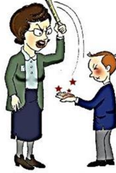
Çocuğa vurmak veya aşığılamak