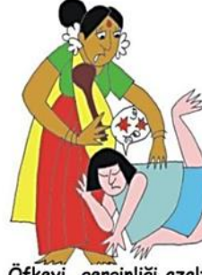
Öfkeyi, gerginliği azaltmak için çocuğu örselemek, itip kakmak