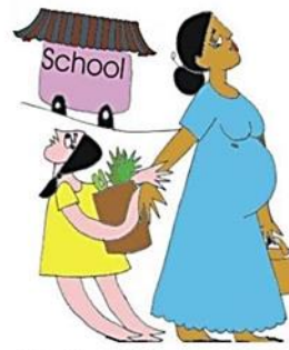
Çocuğun eğitim gereksinimlerini göz ardı etmek