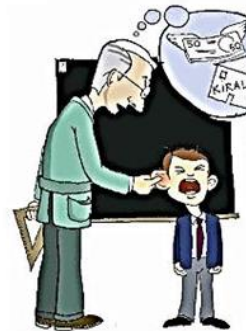
Çocuğu örsleyerek, itip kakarak öfke çıkarmak