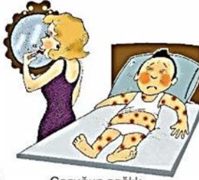
Çocuğın sağlık gereksinimlerini göz ardı etmek