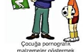
Çocuğa pornografik malzemeler göstermek